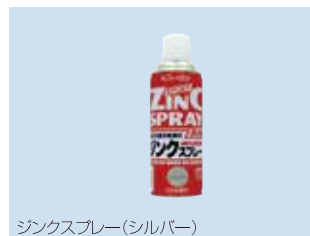
ジンクススプレー(シルバー)