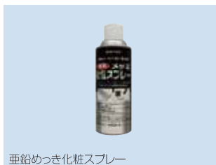
亜鉛めっき化粧スプレー